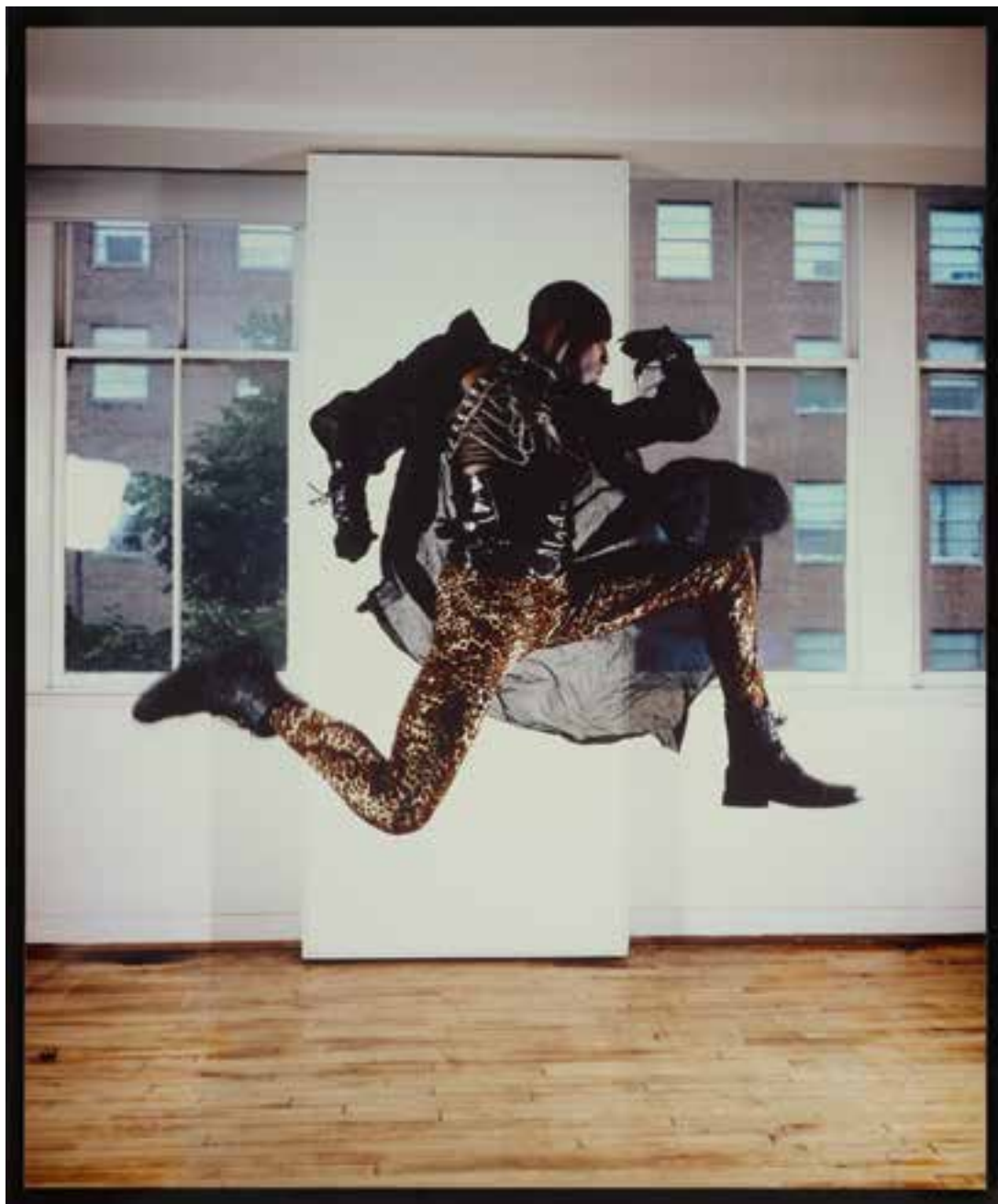
Frédéric Nauczyciel, Vogue / Baltimore, Marquis Revlon , 2011. Tirage lilochrome contrecollé sur aluminium, 152 x 122 cm. Collection MAC VAL – Musée d'art contemporain du Val-de-Marne. © Adagp, Paris 2021.