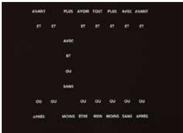
Angela Detanico/Rafael Lain, Marcel X François, Paris, 1932 , série « Chess », janvier 2019. Animation HD, noir et blanc, muet, 5'43". Collection MAC VAL - Musée d'art contemporain du Val-de-Marne. Acquis avec la participation du FRAM Île-de-France. © Angela Detanico/Rafael Lain.