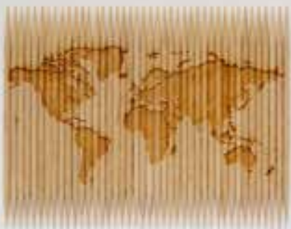
Taysir Batniji, À géographie variable , 2012. Gravure laser, 42 cure-dents, 6,5 x 9 cm, cadre 19 x 22 cm. Photographie © Taysir Batniji. Courtesy de l'artiste. © Adagp, Paris 2021.