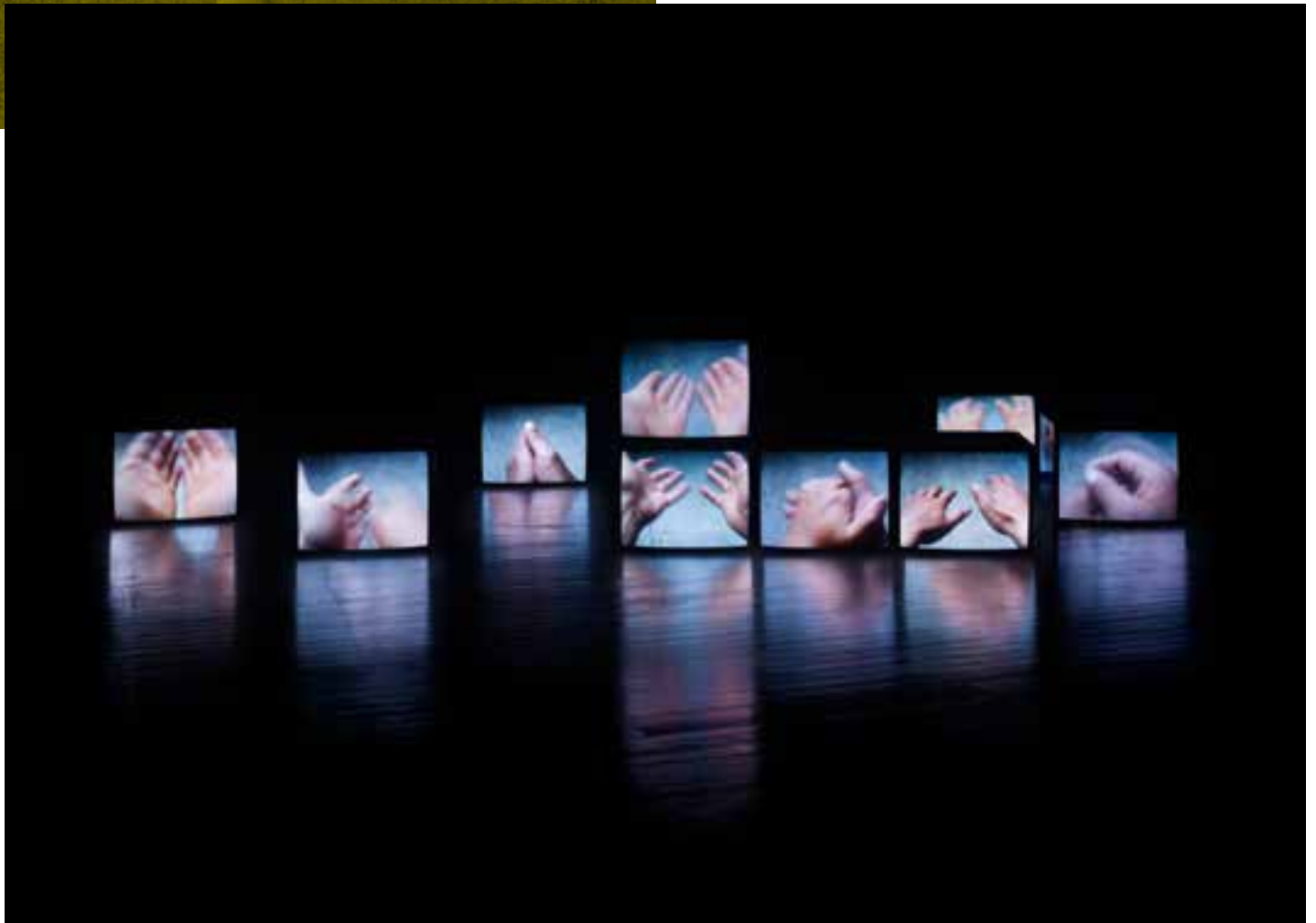
Melik Ohanian, The Hand , 2002. 9 films couleur sonores diffusés chacun sur 1 moniteur, texte au mur, 4'20". Collection MAC VAL - Musée d'art contemporain du Val-de-Marne. Acquis avec la participation du FRAM Île-de-France. © Adagp, Paris 2021.