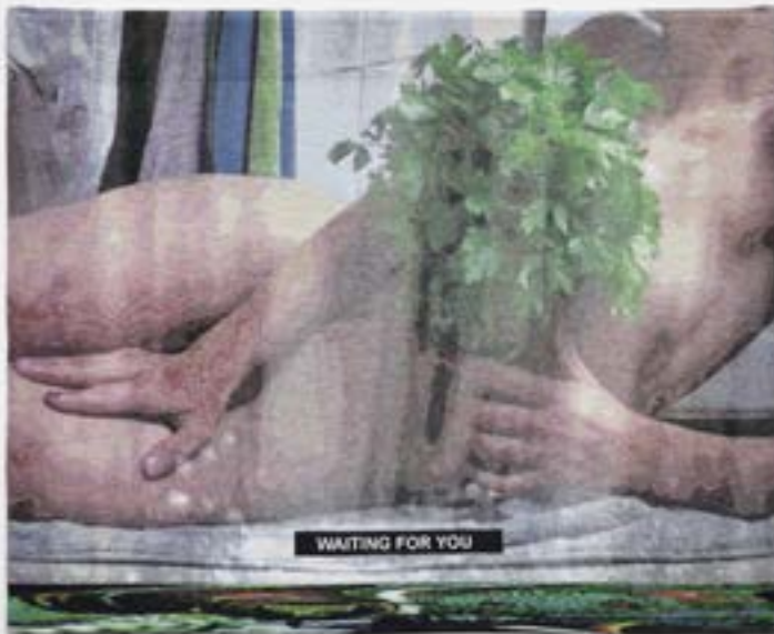
Laure Prouvost, Waiting For You , 2017. Tapisserie, composition de fils de 12 couleurs, trevira, coton, laine et acrylique, 198×245×5 cm. Collection MAC VAL - Musée d'art contemporain du Val-de-Marne. Acquis avec la participation du FRAM Île-de-France. © Adagp, Paris 2019.