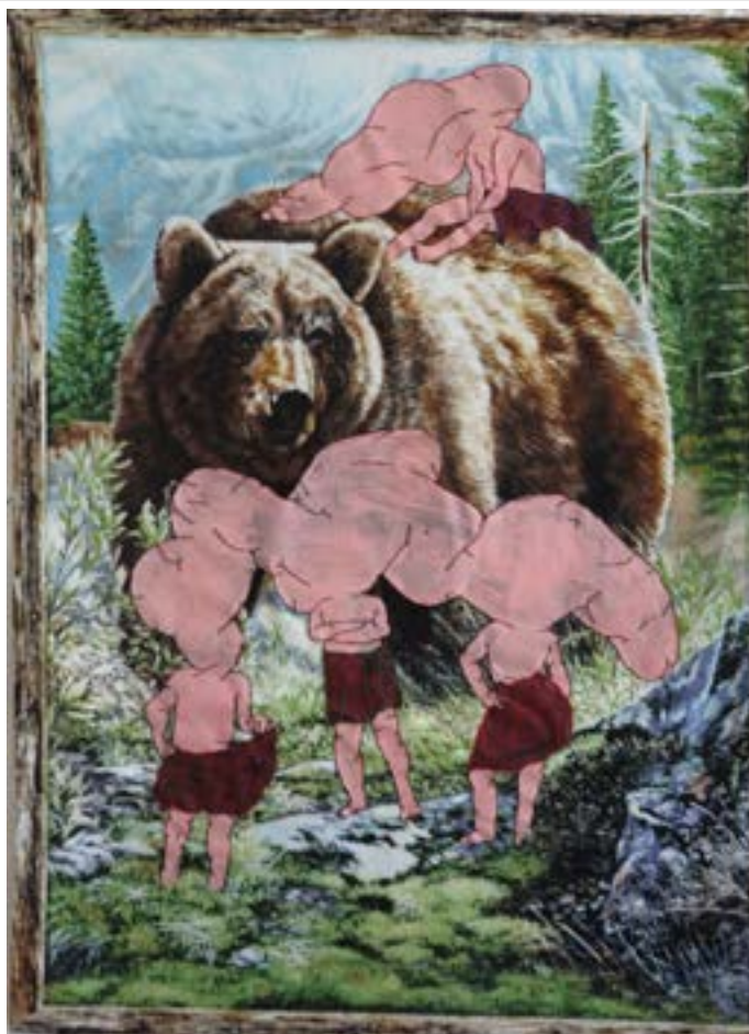
Gözde Ilkin, Organized Habitation-I , 2018. Couture et peinture sur tissu, 55×41 cm.