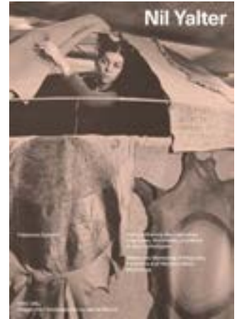
Nil Yalter 288 pages, bilingue français-anglais, 17 x 24 cm, 23 €. Texte de Fabienne Dumont.

Catalogues d'exposition, guides de la collection, actes de colloque, textes de fiction... Les publications du MAC VAL sont le reflet des projets et réalisations artistiques du musée, une invitation à aller plus loin dans la découverte d'une œuvre, à s'ouvrir à d'autres regards. L'ensemble des ouvrages est présenté sur le site internet, rubrique « éditions ». En vente en librairie et à la billetterie du musée.