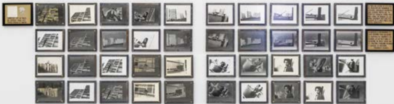
Nil Yalter, Chicago , 1975, détail. Installation, 55 photographies, peinture à l'huile, collages sur carton, vidéo, dimensions variables.