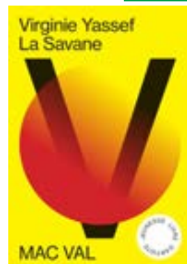
La Savane , par Virginie Yassef Livres d'artiste jeunesse, 48 pages, 23,5 x 16,5 cm, 8 €. Conception, images et texte : Virginie Yassef, à partir de The Velvet de Ray Bradbury.