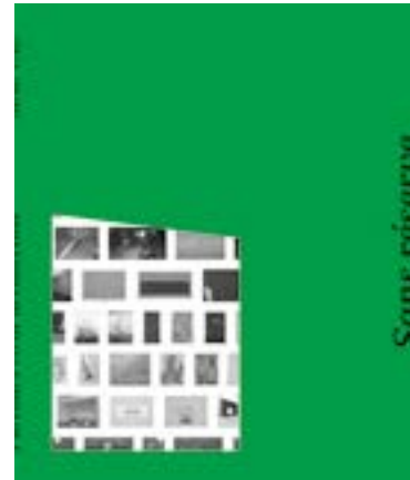
Sans réserve Parcours #8 de la collection du MAC VAL, 192 pages, 160 reproductions, 17 x 21 cm, 15 €. Collectif, textes de l'équipe du musée.