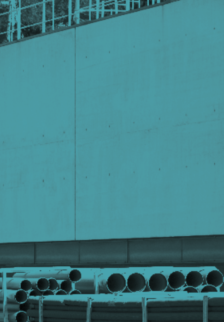
Xie Lei, Pushing , 2013. Huile sur toile, 200×300 cm. Collection MAC VAL - Musée d'art contemporain du Val-de-Marne. Acquis avec la participation du FRAM Île-de-France.