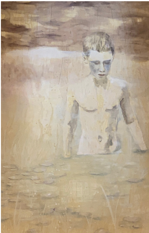
Edi Dubien, L'aube de mon corps , mars 2020. Acrylique sur toile, 300 × 200 × 2,5 cm. Collection MAC VAL – Musée d'art contemporain du Val-de-Marne. Acquis avec la participation du FRAM Île-de-France. © Adagp, Paris 2024.