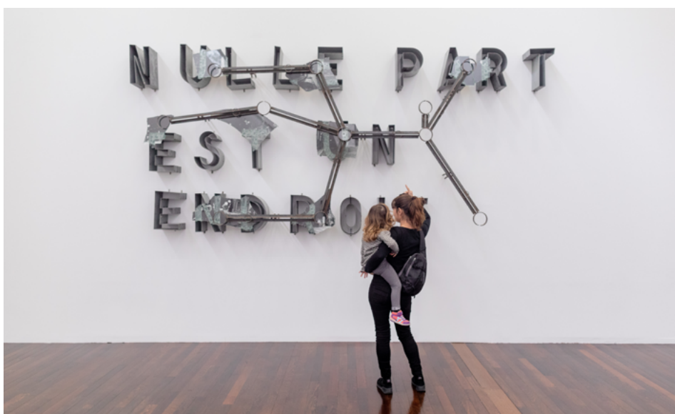
Richard Baquié, Nulle part est un endroit , 1989. Acier inoxydable, structure d'assemblage en acier doux, verre, photographies argentiques noir et blanc contrecollées sur carton, 200 x 446,5 x 40 cm. Collection MAC VAL – Musée d'art contemporain du Val-de-Marne. Acquis avec la participation du FRAM Île-de-France. © Adagp, Paris 2024.

Le MAC VAL s'impose aujourd'hui comme le lieu incontournable de la médiation sensible en France, avec une refonte de ses visites devenant ponctuellement des « plongées », des « cérémonies du regard », des « slow visite », introduisant de nouvelles paroles (hypnothérapeute), des temps longs (30 minutes, une œuvre), de nouvelles règles du jeu, afin de redonner à chacun le pouvoir d'accéder différemment aux œuvres d'art. S'appropriier les œuvres c'est également faire l'expérience d'un parcours inédit avec les premiers « cartels sensibles » de la collection, grâce auxquels grands comme petits, pourront rencontrer les œuvres de manière surprenante et ludique par le corps. De même, une série de nouveaux audioguides est en cours de création pour proposer en 2025 des parcours inédits dans les salles.