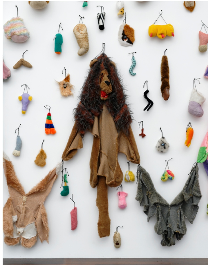
Annette Messenger, Les restes II (détail), 2000. Collection MAC VAL – Musée d'art contemporain du Val-de-Marne. Acquis avec la participation du FRAM Île-de-France. © Adagp, Paris 2024.

Le musée invite des artistes étrangers unanimement reconnus ; les premières expositions en France consacrées à Simon Starling (2009) ou Jesper Just (2012) ont constitué des moments marquants de l'histoire du musée.