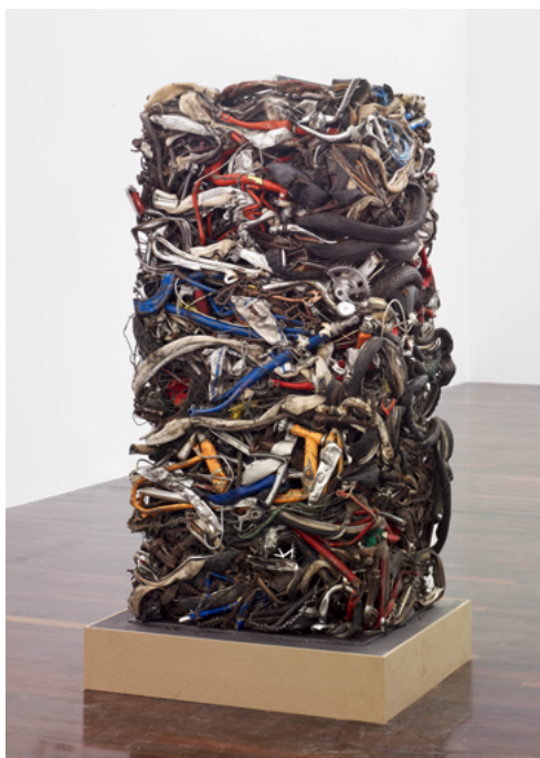
César, Compression , 1995. Bicyclettes compressées, 174 x 88 x 70 cm. Collection MAC VAL – Musée d'art contemporain du Val-de-Marne. © SBJ / Adagp, Paris 2024.