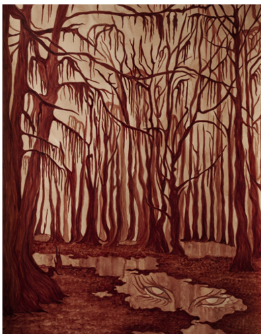
Alison Flora, Les invités des Marais, émission nocturne , 2023. Sang humain sur papier, 76 × 56 cm. Collection MAC VAL – Musée d'art contemporain du Val-de-Marne. © Adagp, Paris 2024.