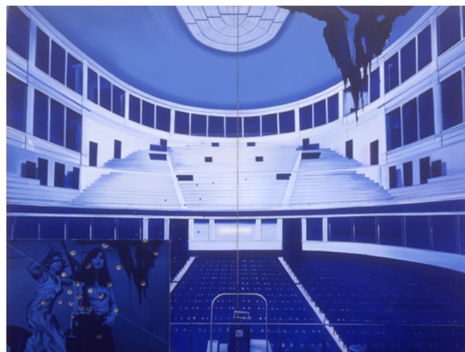
Jacques Monory, Opéra intime n°12 , 1975. Huile sur toile, photographie sous Plexiglas, impacts de balles, 195 × 260 cm. Collection MAC VAL – Musée d'art contemporain du Val-de-Marne. Acquis avec la participation du FRAM Île-de-France. © Adagp, Paris 2024.