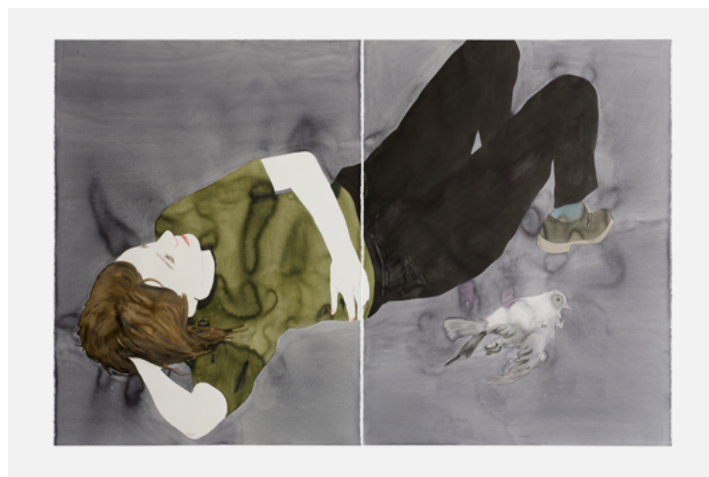
Françoise Pétrovitch, Étendue , série « Étendus » 2016. Aquarelle, lavis sur papier, 160 × 240 cm. Collection MAC VAL – Musée d'art contemporain du Val-de-Marne. © Adagp, Paris 2024. © Françoise Pétrovitch.