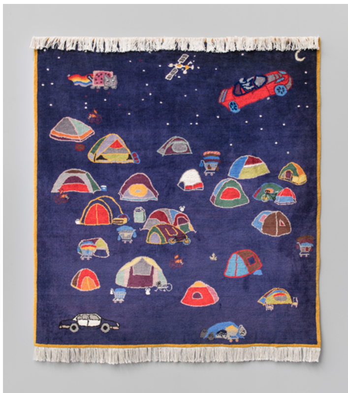
Suzanne Husky, Mars Bitches , 2018. Tapisserie en laine vierge, 148 x 138 cm. Collection MAC VAL – Musée d'art contemporain du Val-de-Marne.