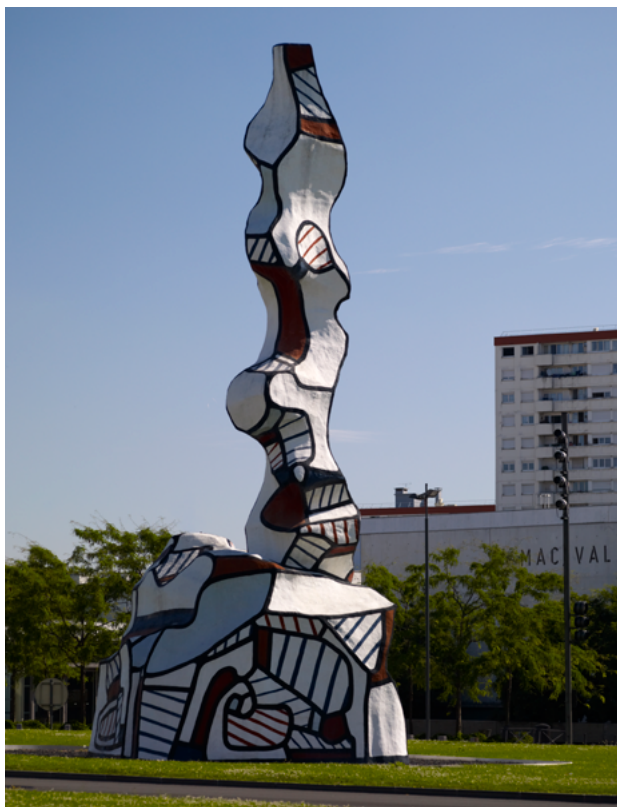
Jean Dubuffet, Chaufferie avec cheminée, 1970-1996. Résine d'époxy armée de fibres de verre, structure métallique interne, peinture polyuréthane, hauteur : 14 m, base : 4,55 x 4,15 m. Œuvre réalisée dans le cadre du 1% artistique.

Ce sont donc près de 100 œuvres installées dans les collèges, parcs ou établissements publics, souvent accompagnées de visites et d'ateliers menés avec les équipes éducatives. L'occasion de faire découvrir ou redécouvrir et ainsi contribuer à l'appropriation par les passants ou élèves des œuvres et du processus artistique.