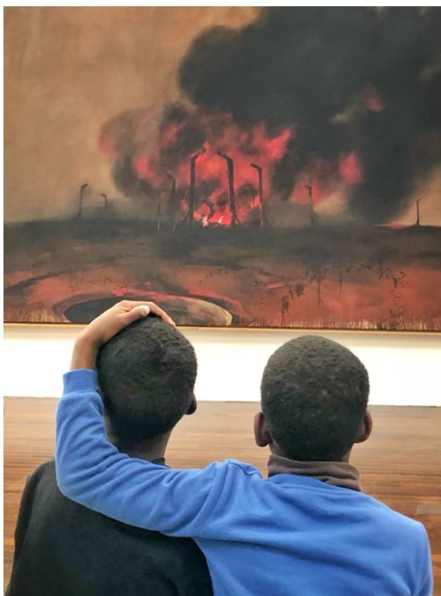
Au fond, Vladimir Veličkovič, « 1992 » #7 (détail), 1997. Huile sur toile, 250 x 500 cm. Collection MAC VAL – Musée d'art contemporain du Val-de-Marne. © Adagp, Paris 2024.