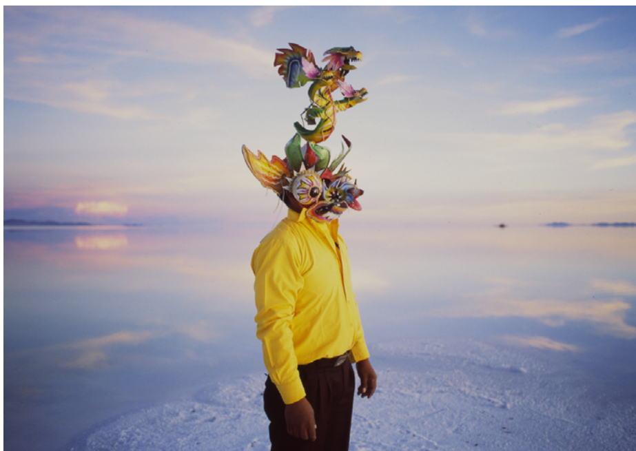
Enrique Ramírez, El diablo , 2011. Tirage Lambda contrecollé sur Dibond, 95 x 120 cm. Collection MAC VAL – Musée d'art contemporain du Val-de-Marne. Acquis avec la participation du FRAM Île-de-France. © Adagp, Paris 2024.

Enfin, la collection comprend un fonds photographique (Jacques Faujour, Sabine Weiss, François Despatin, Christian Gobeli...) et un fonds d'estampes exceptionnel, commandées aux artistes, notamment autour de deux thèmes réguliers, la valorisation de la Roseraie du Val-de-Marne ainsi qu'en hommage à la Journée internationale des droits des femmes.