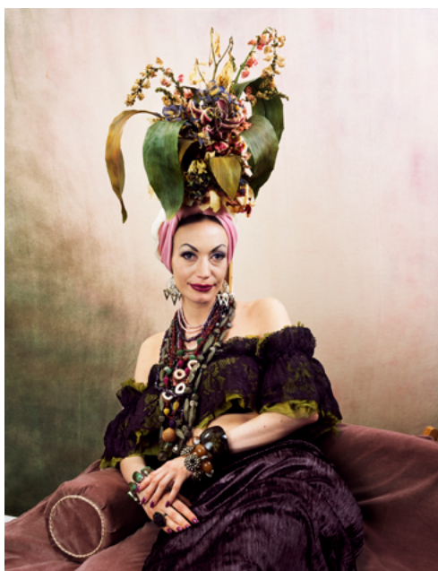
Natacha Lesueur, Sans titre , série « Carmen Miranda », 2019. Impression pigmentaire sur papier, contrecollée sur aluminium, 185 × 145 cm. Collection MAC VAL – Musée d'art contemporain du Val-de-Marne. Acquis avec la participation du FRAM Île-de-France. © Adagp, Paris 2024.

Cette démarche démontre à quel point l'art contemporain est ancré dans différents sujets de la vie, en invitant les visiteurs et visiteuses à prendre la parole sur ces sujets largement partagés.