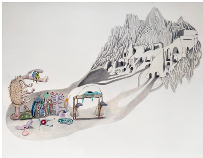
Elika Hedayat, Les Dépossédés #6 , 2022. Crayon, aquarelle sur papier, 56 x 76 cm. Collection MAC VAL – Musée d'art contemporain du Val-de-Marne.