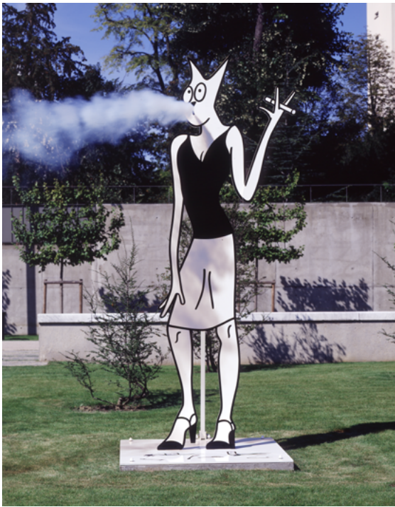
Alain Séchas, Les grands fumeurs (détail), 2007. Sculpture monumentale, 366 x 150 x 150 cm. Collection MAC VAL – Musée d'art contemporain du Val-de-Marne. Acquis avec la participation du FRAM Île-de-France. © Adagp, Paris 2024.