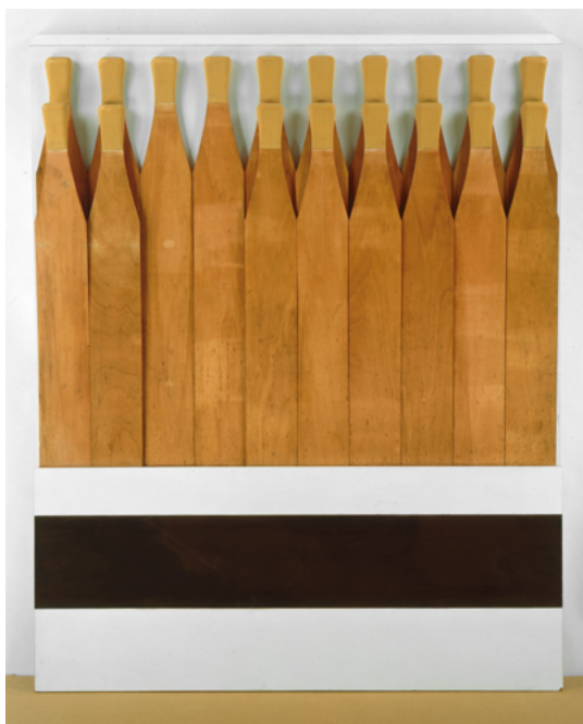
Raymond Hains, Saffa , 1971. Bois, papier de verre, peinture, 198,5 × 158,5 × 15 cm. Collection MAC VAL – Musée d'art contemporain du Val-de-Marne. © Adagp, Paris 2024. Photo © Jacques Faujour.

Le renouvellement fréquent de ces accrochages permet de suivre l'actualité et d'aborder des sujets variés, tant de la société que de l'histoire de l'art : la peinture aujourd'hui (« Avec et sans peinture »), l'exil (« Je revierdrai »), le souvenir (« Nevermore, souvenir, souvenir, que me veux-tu ? »), l'avenir (« Vivement demain ») ou encore l'histoire de l'art « L'œil vérité ». Il n'y a pas d'art plus en résonance avec son temps que l'art contemporain, qui utilise les formes mêmes de son époque pour en proposer un reflet critique, réaliste parfois, poétique et distancié souvent. Aujourd'hui plus que jamais les artistes sont en réaction avec la réalité de notre époque. Des invitations d'artistes au cœur de ces parcours, comme autant de fenêtres ouvertes sur le monde, sont proposées régulièrement au public et créent un nouveau dialogue entre l'artiste et la collection.