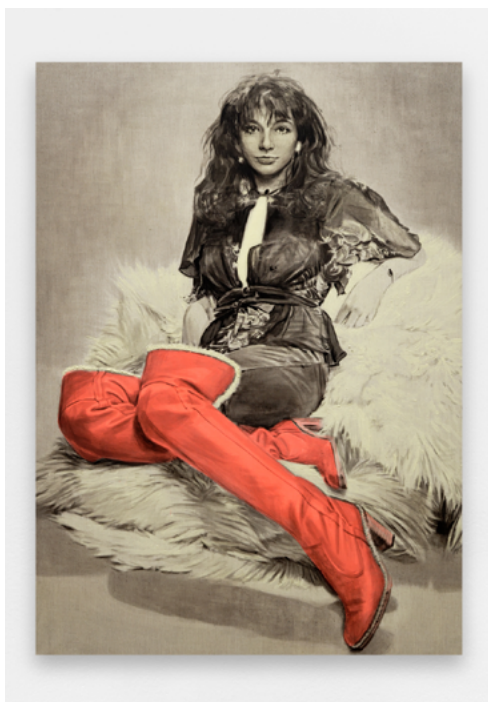
Nina Childress, 1048 - Bush, bottes rouges , 2020. Acrylique phosphorescente, huile sur toile, 250 x 180 cm. Collection MAC VAL – Musée d'art contemporain du Val-de-Marne. Acquis avec la participation du FRAM Île-de-France. © Adagp, Paris 2024.

La collection du musée est née en 1982 dans le cadre de la création du Fonds départemental d'art contemporain (FDAC), avec pour principal objectif de soutenir les artistes. La collection s'est développée dans une perspective pluraliste, ouverte sur le monde et attentive à la population artistique diversifiée du territoire.