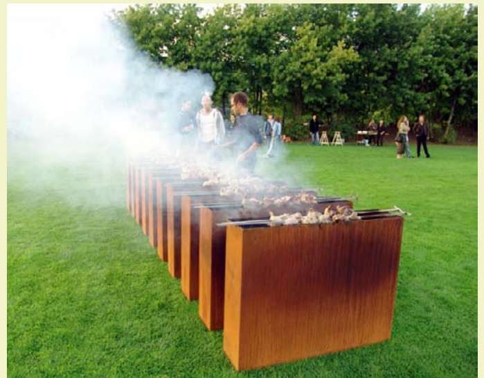
Untitled Barbecue, acier corten, 2004.