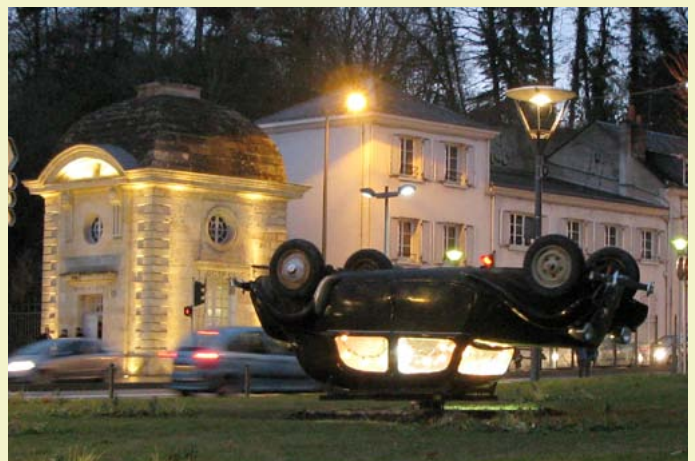
Claude Lévêque, Mon Repos à Tours , exposition Les Nuits d'après , place Choiseul, Tours, 2010.