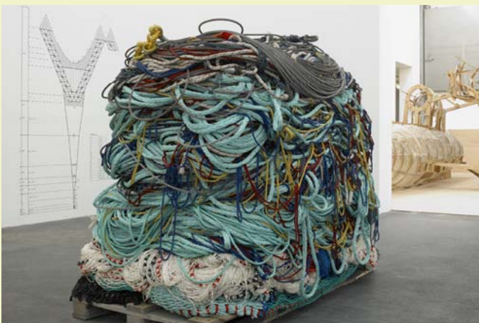
La Tour pélagique, nylon, câble, chaîne, 2008.