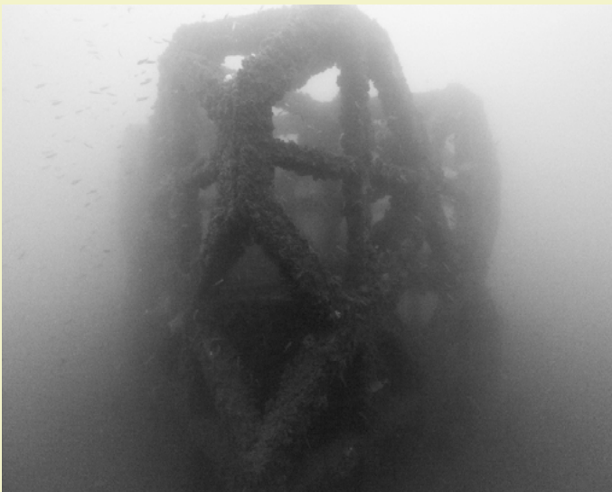
Structures productives, récif artificiel, -3 l m, Portugal, 2012.

Né en 1970 à Rennes et diplômé de la Glasgow School of Art, il vit et travaille à Paris et à Vouvray.