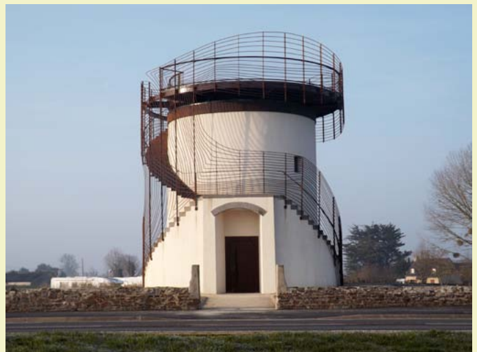
Jean-Luc Vilmouth, Le Belvédère des ondes , Saint-Benoît-des-Ondes (35), œuvre permanente, Nouveaux commanditaires, 2012.