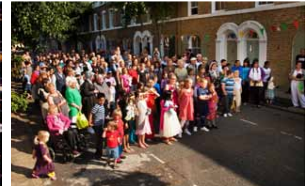
Melanie Manchot, Celebration (Cyprus Street) , 2010. © Commissioned by Film and Video Umbrella, Londres.