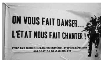
Photos et tracts contre l'interdiction des « free parties » et les confiscations de matériel.