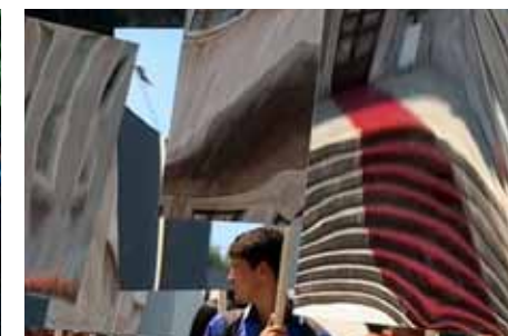
— Mircea Cantor, The Landscape is Changing , vidéo, 2003.