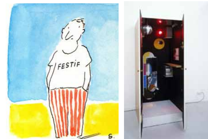
Sempé, Festif .

Danses, regroupements et autres foules festives nous invitent à réfléchir sur le rapport de l'individu au collectif, entre quête passionnée de l'unisson et expérience de la solitude ou de l'ennui au milieu des autres.