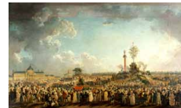
P.-A. Machy, La Fête de l'Être Suprême, le 8 juin 1794 .

Alain Corbin, La Fête de Souveraineté, La Tradition politique des fêtes interprétation et appropriation , in Les usages politiques des fêtes aux XIX e -XX e siècles , Publications de la Sorbonne, 1994.