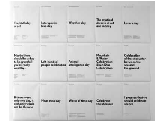
Pierre Huyghe, One Year Celebration , 2006, © Tate, Londres, 2010.