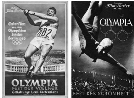
— Leni Riefenstahl, affiche du film en deux parties, Olympia, Fest der Voelker [Fête des peuples], 1938.