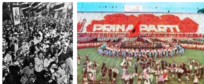
— Fête populaire en URSS. Photo publiée dans la brochure Le Pavillon de l'URSS à l'Exposition universelle de Bruxelles en 1958.