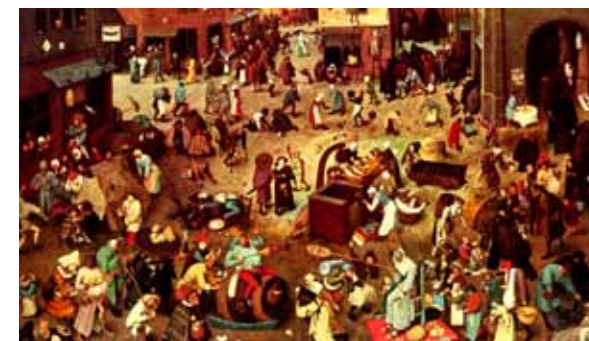
Pieter Bruegel l'Ancien, Combat de Carnaval et de Carême , 1559.

Voltaire, Dictionnaire philosophique , Fêtes, section I (extrait), 1764.