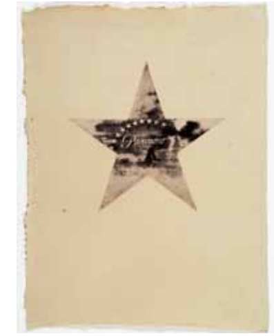
Jean-Luc Verna, Paramour , 2007.

Pierre Huyghe invite architectes, musiciens, chorégraphes et commissaires d'exposition à inventer de nouveaux jours fériés. Cette œuvre collective nous offre quarante-huit nouvelles dates à fêter. Les commémorations historiques et les jours de fêtes religieuses font place à des célébrations sociales, sentimentales, environnementales, artistiques... L'artiste déstructure notre rapport au temps en supprimant le caractère exceptionnel de ces célébrations. Cette saturation d'événements nous laisse imaginer un état permanent de festivités qui revêtirait chaque jour un nouveau visage.