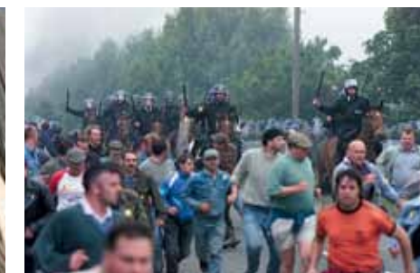
Jeremy Deller, The Battle of Orgreave, 2001.