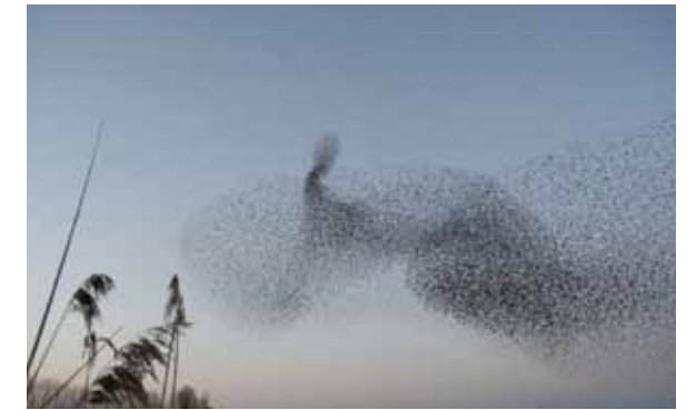
Vol d'étourneaux, anonyme.

En réalité, ce comportement a une autre explication, toute aussi étonnante : il s'agit d'un comportement de groupe ; en effet, certains comportements ne sont pas liés à un seul oiseau, mais plutôt au collectif. Il n'y a pas de leader, pas de contrôle supérieur.