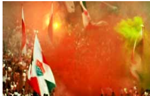
Stephen Dean, Volta , 2003, vidéo. Collection du MAC/VAL.

Celebration (Cyprus Street) est un film 35 mm qui montre, en un plan séquence, une street fair , véritable tradition de l'East End londonien. S'inspirant des témoignages et des photographies prises lors des manifestations du siècle dernier, Melanie Manchot organise, au début de l'année 2010, de nouvelles festivités en collaboration étroite avec la communauté résidant à Cyprus Street.