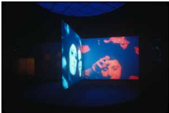
Doug Aitken, Hysteria , 1998. Courtoise 303 Gallery, New York.

Avec Hysteria , Doug Aitken réalise un montage de séquences d'archives de scènes d'hystérie collective provenant d'images de concerts de rock. En commençant par le phénomène le plus connu, les Beatles en 1964, en montant les images de manière chronologique, Doug Aitken, dans une démarche presque sociologique, met en avant l'évolution des styles et des comportements. Ces spectateurs en transe qui entrent en communion renvoient tout autant à des images de ferveur religieuse qu'au chœur de la tragédie grecque, symbole de la foule tout entière en proie à l'émotion dionysiaque.