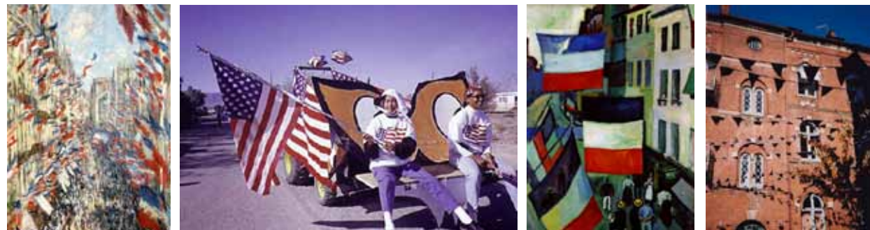
Claude Monet, La rue Montorgueil à Paris, fête du 30 juin 1878 , 1878.

Témoigner de la liesse, de ce moment particulier où le bonheur d'être ensemble prend le pas sur la distinction entre individus, est depuis longtemps un sujet de représentation. Qu'ils soient de simples marqueurs de la fête ou des emblèmes communautaires, les fanions et drapeaux sont les signes récurrents de ces célébrations.