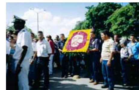
— Bruno Serralongue, Portrait d'Ernesto Guevara, La Havane, 13 octobre 1997.

Qu'il s'agisse de déplacer le point de vue comme dans les photographies de Bruno Serralongue, d'organiser des célébrations muettes et décalées comme dans les marches avec miroir de Mircea Cantor ou de rejouer des scènes de conflits récents comme dans les vidéos de Jeremy Deller, les artistes proposent un contrepoint, tour à tour poétique ou critique, aux représentations traditionnelles.