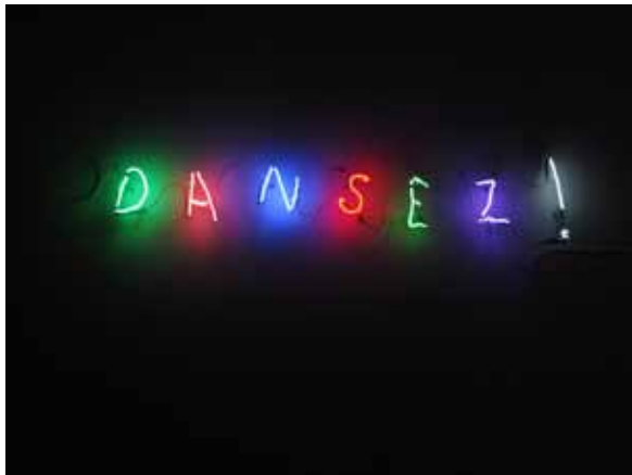
Claude Lévêque, DANSEZ! , 1995.

Par le chant et la danse, l'homme manifeste son appartenance à une communauté supérieure: il a désappris de marcher et de parler et, dansant, il est sur le point de s'envoler dans les airs. Ses gestes disent son ensorcellement. De même que les animaux maintenant parlent et la terre donne lait et miel, de même résonne en lui quelque chose de surnaturel: il se sent dieu, il circule lui-même extasié, soulevé, ainsi qu'il a vu dans ses rêves marcher les dieux.