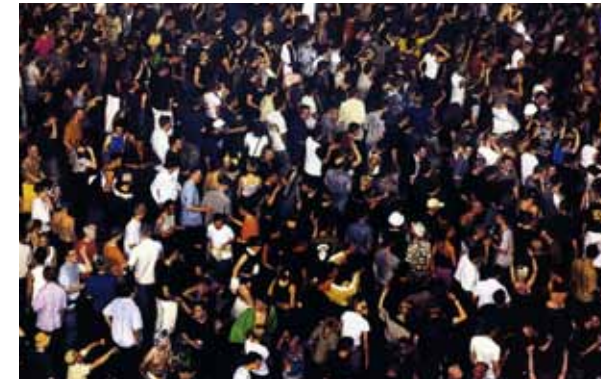
Andreas Gursky, May Day IV , 2000 (détail).

Celebration (Cyprus Street) est un film 35 mm qui montre, en un plan séquence, une street fair , véritable tradition de l'East End londonien. S'inspirant des témoignages et des photographies prises lors des manifestations du siècle dernier, Melanie Manchot organise, au début de l'année 2010, de nouvelles festivités en collaboration étroite avec la communauté résidant à Cyprus Street.