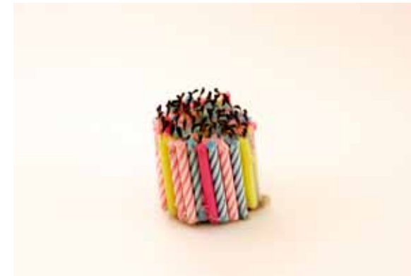
Anne Brégeaut, Anniversaire , 2006.

Que ce soit en privé ou au contraire à travers les réseaux sociaux mondialisés, l'anniversaire de naissance revêt aujourd'hui un caractère d'obligation, a fortiori, l'ampleur de sa célébration serait proportionnelle à l'importance de la place de l'individu au sein de la communauté. Cette célébration est pourtant récente. Au Moyen-Âge, on fête le jour du saint dont on porte le nom. Ce sont les protestants qui, au XVII e siècle, marquèrent les anniversaires de naissance. En France, il commence à être fêté un siècle plus tard, au XVIII e siècle, lors de la reconnaissance du moi et la valorisation de l'individu. À cette période succédera celle de l'industrialisation et la célébration de la marchandise.