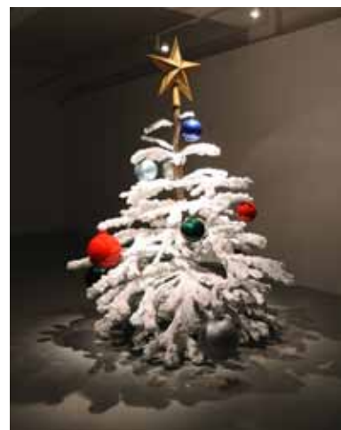
Philippe Parreno, Fraught Times: For Eleven Months of the Year It's an Artwork and in December It's Christmas (March) , 2009. Collection Vanmoerkerke, Belgique.