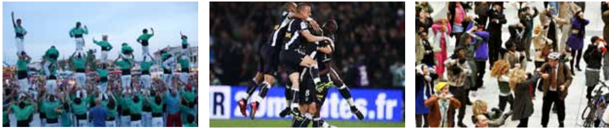
Pyramide humaine, anonyme.