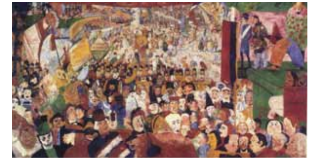
James Ensor, L'Entrée du Christ à Bruxelles , 1888. 2,58 x 4,30 m, Los Angeles, Getty Museum.

James Ensor a peint ce tableau en 1888, à une époque où les tensions croissantes entre Flamands et Wallons, entre libéraux et catholiques, menacent la toute jeune Belgique. Des conflits sociaux s'enveniment un peu partout dans le pays et des manifestations de travailleurs sont réprimées dans le sang. C'est dans ce contexte qu'Ensor dépeint une sorte de carnaval, une danse macabre où se côtoient les différents corps de la société : au fond, une fanfare militaire, devant, un juge, un évêque, des notables, le militant socialiste Édouard Anseele ; autour, des drapeaux aux couleurs de la France et de la Belgique, ainsi que de multiples fanions qui accompagnent une grande banderole rouge sur laquelle est inscrit « Vive la sociale ».