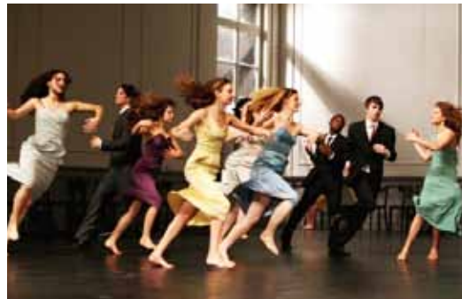
Vidéogramme du spectacle Kontakthof de Pina Baush, 2009.