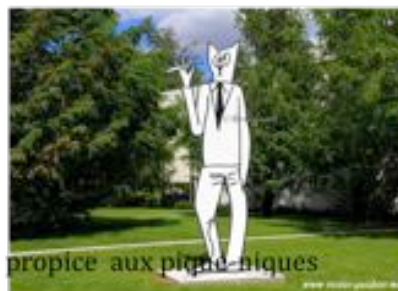
Parc du musée propice aux pique-niques

Possible dans le restaurant du MAC/VAL ou alentours