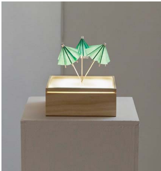
Adrien Siberchicot, Parasols , 2012 20 x 20 x 8 cm

Des exemples de portraits et de paysages vidéo seront montrés en résonance avec l'exposition d'Ange Leccia.