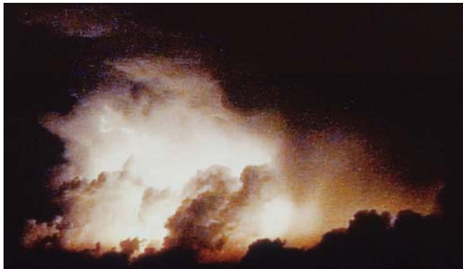
Ange Leccia, L'orage , 1999, arrangement vidéo, collection du MAC/VAL. © ADAGP, Paris 2013