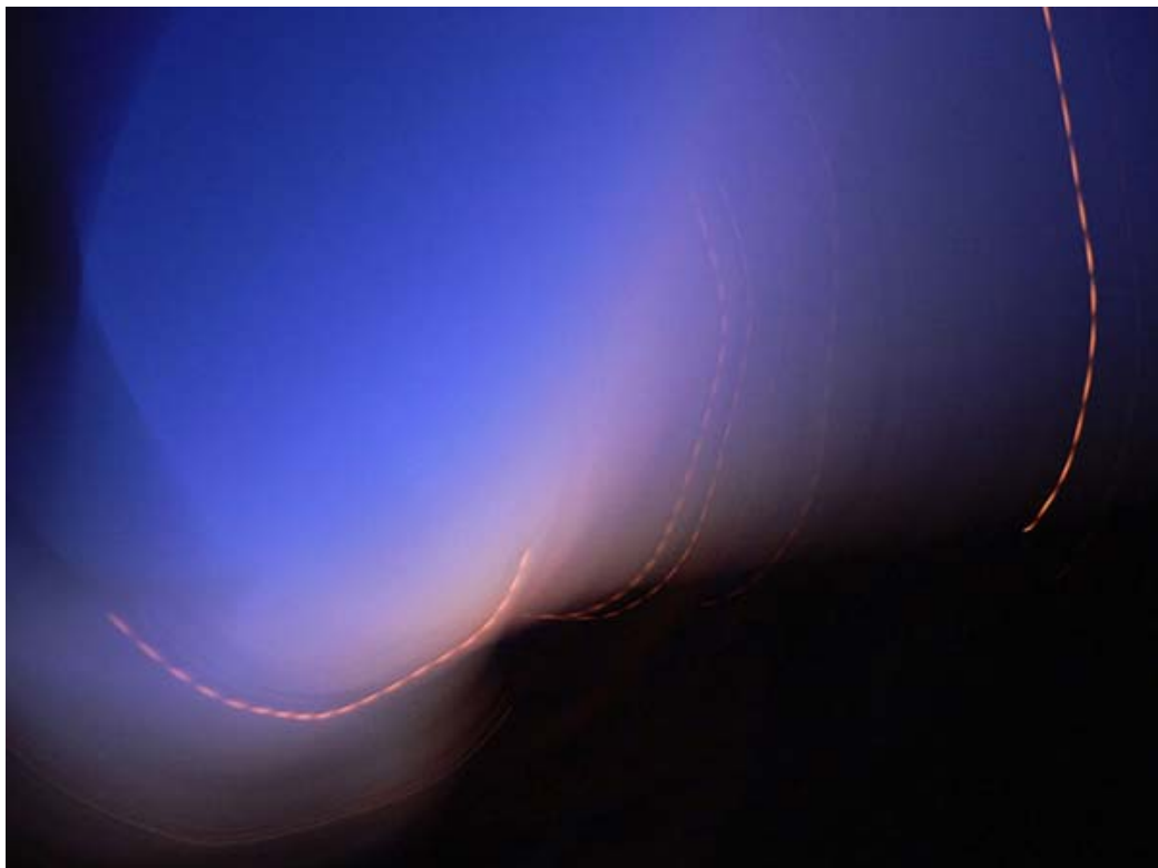
Luc Pelletier, ignace , 2005

Les réalisations de la semaine pourront être exposées samedi et dimanche.