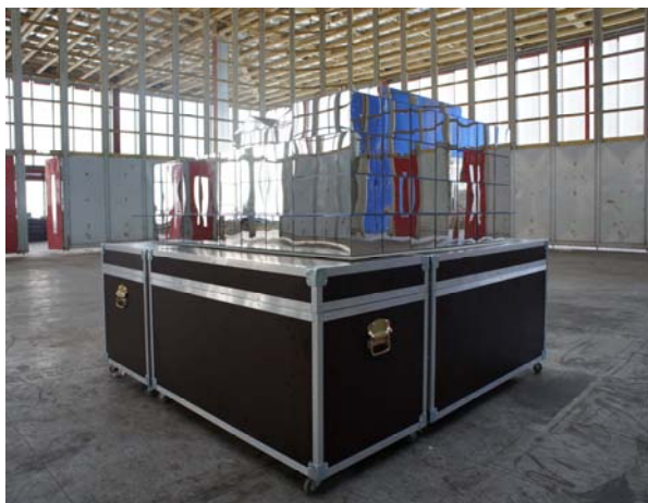
Dominique Blais, Sans titre (35-39) , PMMA miroir, flight cases, électronique, mécanique, film 16/9. Maison du Peuple, Clichy-la-Garenne, 2013. Courtesy l'artiste et galerie Xippas, Paris. Photo © DR.