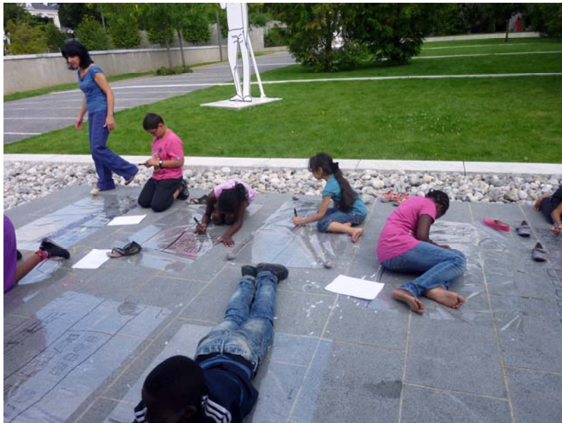
Les Fabriques des Portes du temps au MAC/VAL, 2010.

Devenues autonomes et porteuses de mémoire, ces petites séquences chorégraphiques seront rejouées collectivement dans le parc, déformées, ralenties ou à l'envers.