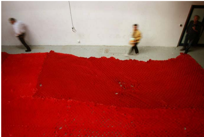
Jean-Guillaume Gallais Tapis , dimensions variables, papier de soie, 1998

Ce sera comme une danse du prénom, l'occasion de créer des déplacements, des gestes, des mouvements inédits et personnels, comme notre prénom !