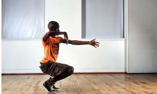
Frédéric Nauczyciel « Légendary ». Performances, Baltimore, 2011.

L'Amicale de production, groupe de recherche autour du jeu et surtout de la règle et de son énonciation, met en place