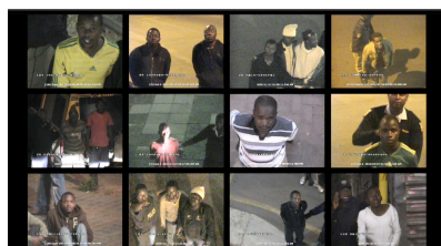
Mikhael Subotzky, CCTV , 2012.

Ces deux résidences d'artistes au MAC/VAL ainsi qu'un focus sur la scène vidéo sud-africaine visent à montrer la vitalité de la scène artistique sud-africaine. Ces événements s'inscrivent dans la politique culturelle départementale du Val-de-Marne, qui entretient des relations privilégiées avec l'Afrique du Sud depuis des décennies.