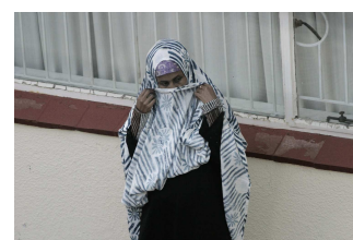
Mikhael Subotzky, Don't even think of it , 2012.